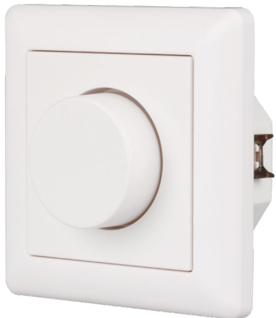
022155 Панель Rotary SR-2836N-A-RF-IN