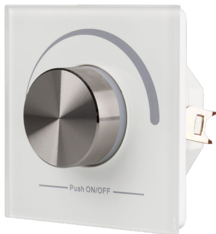
022516 Панель Rotary SR-2836N-B-RF-IN