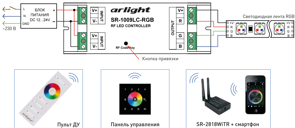
Рис. 2. Схема подключения оборудования на примере контроллера SR-1009LC-RGB.